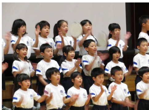
振りをつけて元気に歌う2年生

コミュニティスクールになった大藪小学校ですので、授業や朝の会など、いつでも参観ください。事前に連絡をしていただかなくても、当日、職員室または校長室に声をかけていただければ結構です。