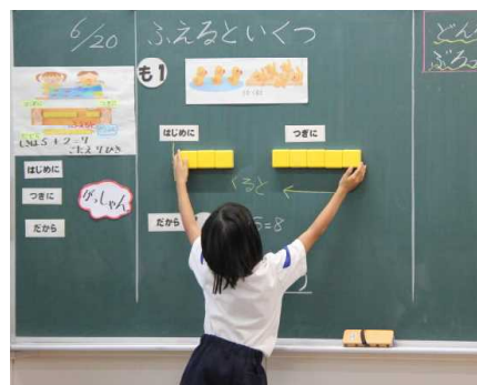
動作を加えながら説明する1年生