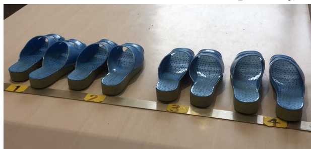
2月23日(金)午前11時15分の2階男子トイレ