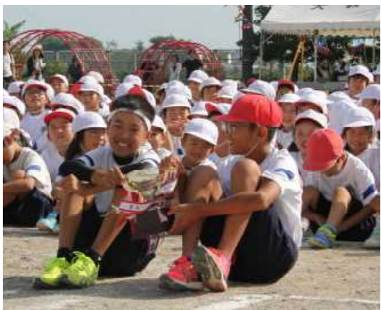
〈仲よく優勝カップを持ち合う応援リーダー〉