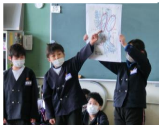
【5年：水とのたたかい】