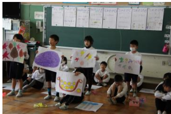
【1年：1年生がんばったよ】

今年度の「ふるさと学習発表会」は、一人一人の活躍の場をさらに増やすことや多くの保護者の方に参観していただけること、一つ下の学年の児童が来年度の取り組みへの見通しがもてることを願い、授業参観日と下学年を招いての発表の場を設定しました。残念ながら、3年生と5年生は、インフルエンザのために、「学年閉鎖」となり、授業参観として行うことはできませんでした。しかし、2/8に、3年生は2年生を招いて、5年生は4年生を招いて、それぞれの活動や学んだことを、自信をもって発表しました。1年生は、こども園の子を招いて発表をしました。子どもたちは、準備の段階からわかりやすく楽しい発表にしようと、グループで相談したり練習を進めたりと生き生きと活動していました。また、参観する子どもたちにとっても、大藪や輪之内について理解と関心を深めるとともに、次の学年での活動への意欲をもつことができました。「ふるさと学習」を進めるにあたっては、地域の方にも講師として、大変お世話になりました。今後とも、「ふるさと輪之内・大藪」を愛し、進んで調べ、かかわったり働きかけたりすることのできる児童を目指して、この活動を大切にしていきたいです。