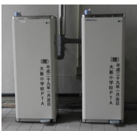
【ウォータークーラーの設置】