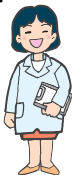
ほけんのせんせい